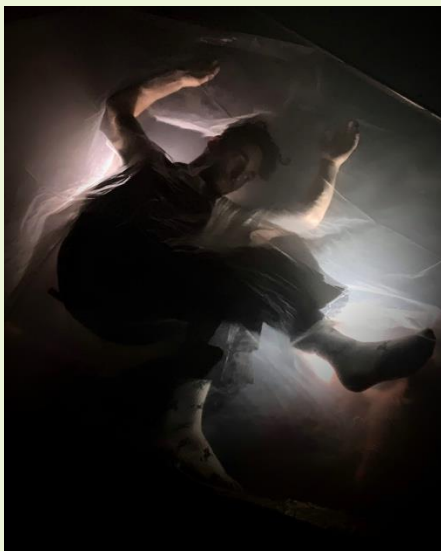
Guillaume Saindon Conception vidéo