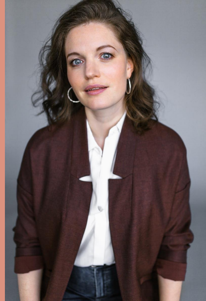
Noémie F. Savoie Texte, recherche et interprétation